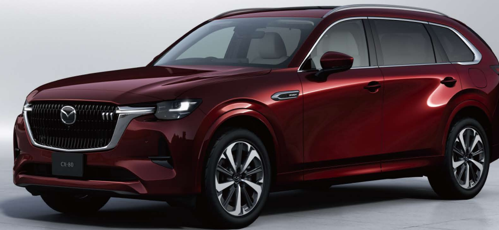
Body Color:アーティザンレッドプレミアムメタリック