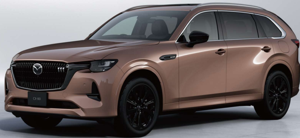
Body Color:メルティングカッパーメタリック