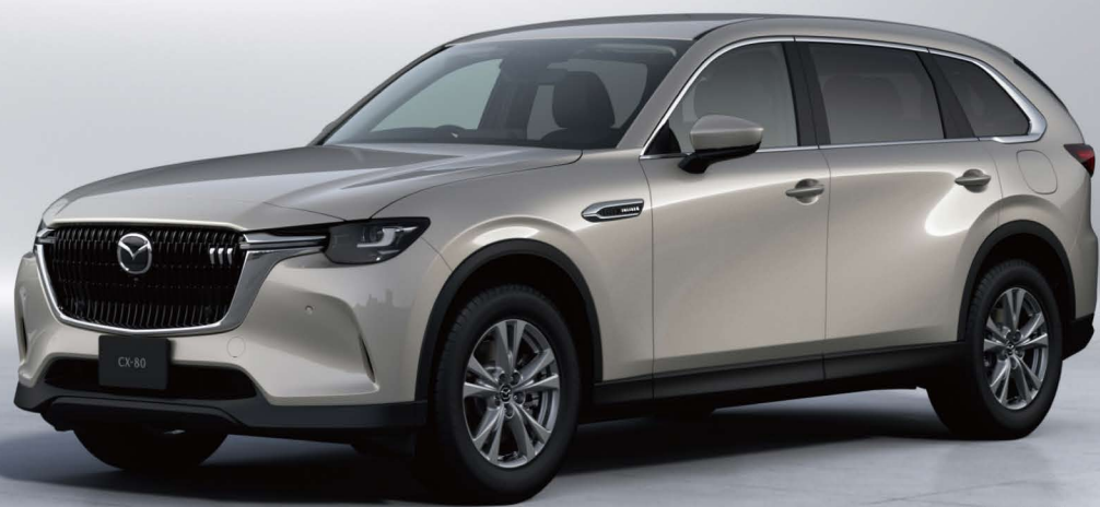
Body Color:プラチナホワイトメタリック